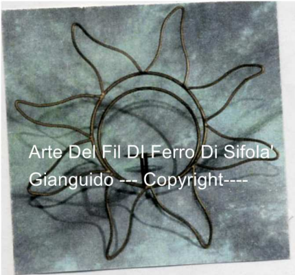
Arte Del Fil Di Ferro Di Sifola' Gianguido --- Copyright----