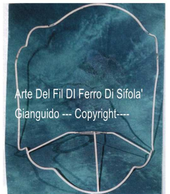
Arte Del Fil Di Ferro Di Sifola' Gianguido --- Copyright----