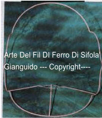
Arte Del Fil Di Ferro Di Sifola' Gianguido --- Copyright---