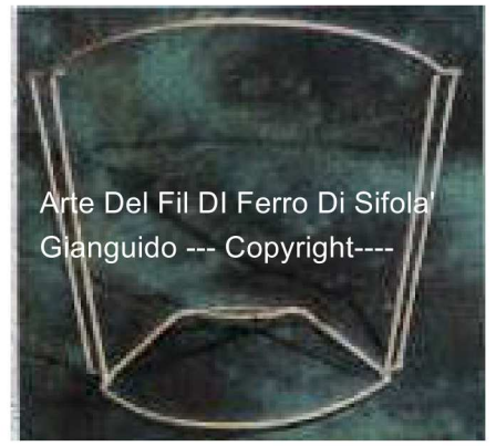
Arte Del Fil Di Ferro Di Sifola' Gianguido --- Copyright---