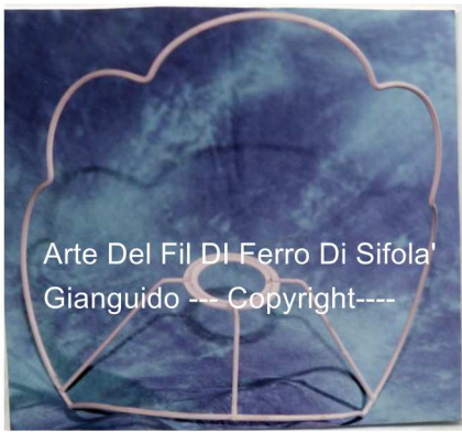
Arte Del Fil Di Ferro Di Sifola' Gianguido --- Copyright----