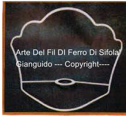
Arte Del Fil Di Ferro Di Sifola' Gianguido --- Copyright---