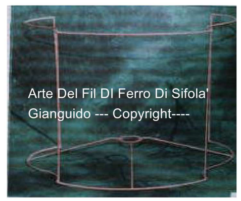
Arte Del Fil Di Ferro Di Sifola' Gianguido --- Copyright---