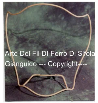
Arte Del Fil Di Ferro Di Sifola' Gianguido --- Copyright----