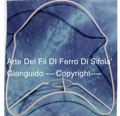
Arte Del Fil Di Ferro Di Sifola' Gianguido --- Copyright----