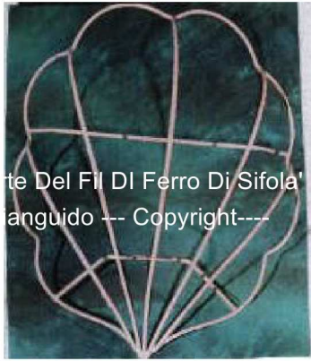
Arte Del Fil Di Ferro Di Sifola' Gianguido --- Copyright---