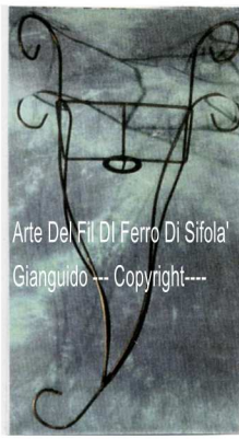
Arte Del Fil Di Ferro Di Sifola' Gianguido --- Copyright----