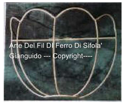
Arte Del Fil Di Ferro Di Sifola' Gianguido --- Copyright---