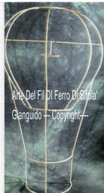
Arte Del Fil Di Ferro Di Sifola' Gianguido --- Copyright---