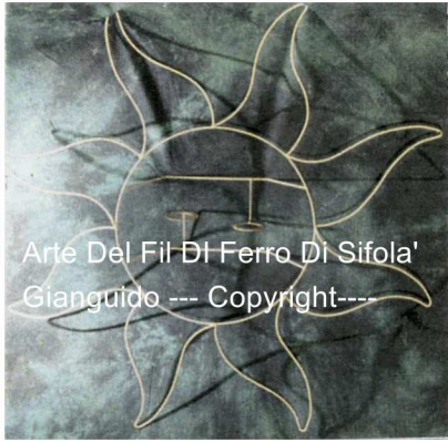
Arte Del Fil Di Ferro Di Sifola' Gianguido --- Copyright----