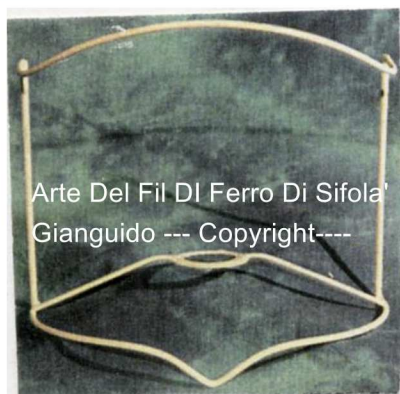
Arte Del Fil Di Ferro Di Sifola' Gianguido --- Copyright---