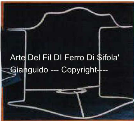
Arte Del Fil Di Ferro Di Sifola' Gianguido --- Copyright---