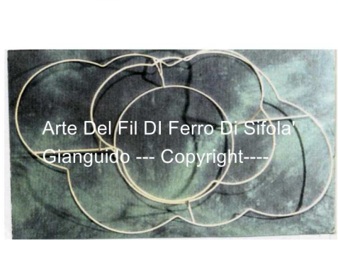
Arte Del Fil Di Ferro Di Sifola' Gianguido --- Copyright---