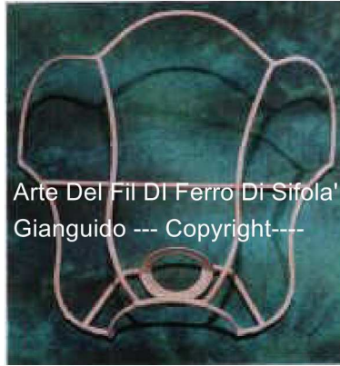
Arte Del Fil Di Ferro Di Sifola' Gianguido --- Copyright---