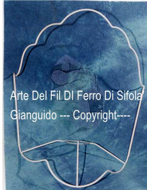
Arte Del Fil Di Ferro Di Sifola' Gianguido --- Copyright----