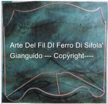
Arte Del Fil Di Ferro Di Sifola' Gianguido --- Copyright---